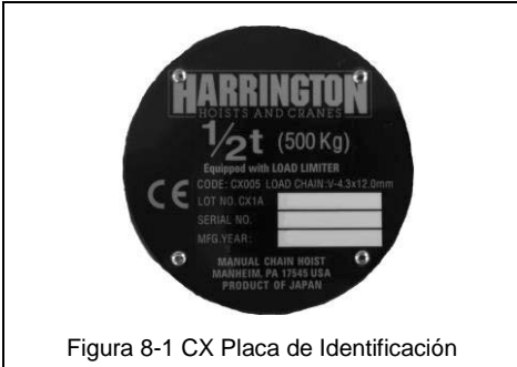
Figura 8-1 CX Placa de Identificación

Cuando ordene Partes, proporcione el número de código del Polipasto, el número de lote y el número de serie que se encuentran en la placa de identificación del Polipasto (consulte la Figura 8-1 a continuación). Recuerde: De acuerdo con las Secciones 3.4.3 para ayudar en el pedido de partes y soporte del producto, registre el Código del polipasto, el Lote y el Número de Serie en el espacio provisto en la portada de este manual.